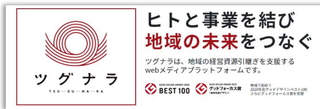
「ツグナラ全国版」トップ画面 ( https://tgnr.jp/ )