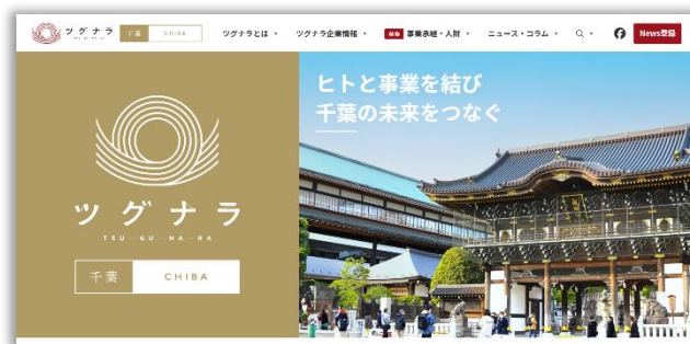
「ツグナラ千葉」トップ画面 ( https://tgnr.jp/chiba/ )

ツグナラは「次世代により良い社会を引き継ぐ」をメインコンセプトに「地域未来を担う企業」として「地域の経営資源引き継ぎ」を全面的に打ち出し、M&A のみではなく親族内の事業承継、働く社員、ステークホルダー、外部への承継など、ありとあらゆる経営資源の引き継ぎを促進していく事業承継支援サービスです。地域内同士での地域経営資源の引き継ぎを希望する企業に対して、地域未来を担う企業と迅速にマッチングすることで結果として地域経済が活性化することを目標に運営をしております。