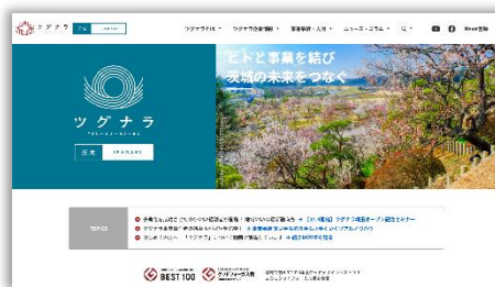
「ツグナラ茨城」トップ画面 ( https://tgnr.jp/ibaraki/ )