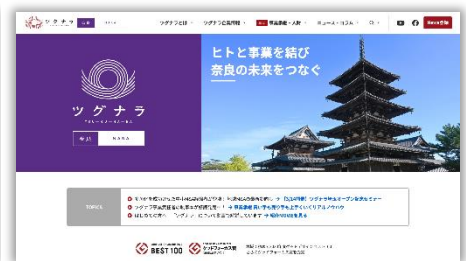
「ツグナラ奈良」トップ画像 ( https://tgnr.jp/nara/ )