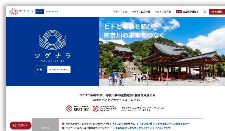
「ツグナラ神奈川」トップ画面 ( https://tgnr.jp/kanagawa/ )