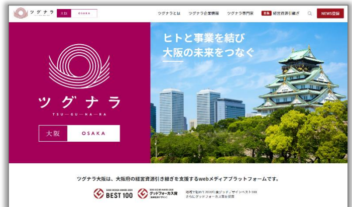
「ツグナラ大阪」トップ画面 ( https://tgnr.jp/osaka/ )

ツグナラは「次世代により良い社会を引き継ぐ」をメインコンセプトに「地域未来を担う企業」として「地域の経営資源引き継ぎ」を全面的に打ち出し、M&Aのみではなく親族内の事業承継、働く社員、ステークホルダー、外部への承継など、ありとあらゆる経営資源の引き継ぎを促進していく事業承継支援サービスです。地域内同士での地域経営資源の引き継ぎを希望する企業に対して、地域未来を担う企業と迅速にマッチングすることで結果として地域経済が活性化することを目標に運営をしております。